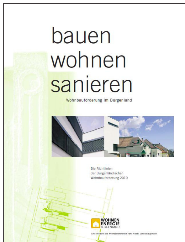
Informationsbroschüre zur Wohnbauförderung im Burgenland

Dieser Ratgeber basiert auf einer Idee der „Energieberatung Niederösterreich“; als Vorlage diente der Ratgeber 16, „Moderne Holzheizungen (komfortabel - preiswert - umweltfreundlich)“ welcher an die Burgenländischen Verhältnisse angepasst wurde.