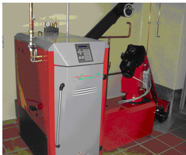
Hackschnitzelheizung Sommerauer - Lindner

Heizkosten: ca. € 1.000,- pro Jahr **) - durch gute Dämmung können die Heizkosten mehr als halbiert werden!