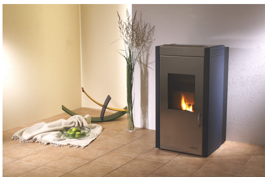
Modell Twist

Heizkosten: ca. € 1.350,- pro Jahr **) - durch gute Dämmung können die Heizkosten mehr als halbiert werden!