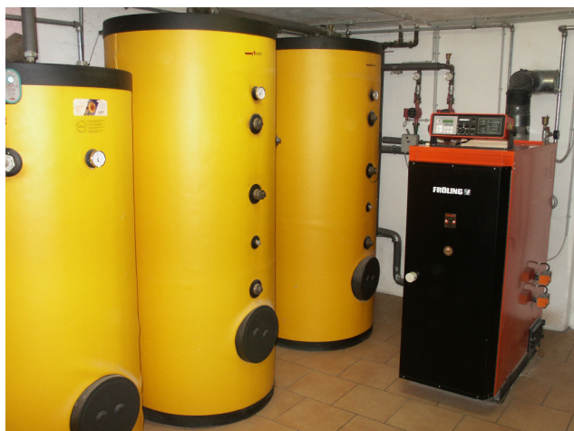
Holzvergaserkessel mit Pufferspeicher

Heizkosten: ca. € 1.150,- pro Jahr *) - durch gute Dämmung können die Heizkosten mehr als halbiert werden!